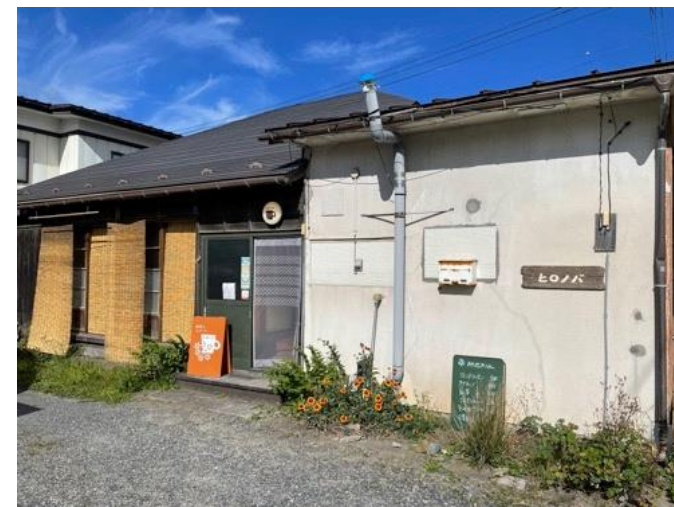
喫茶とスペース ヒロノバ