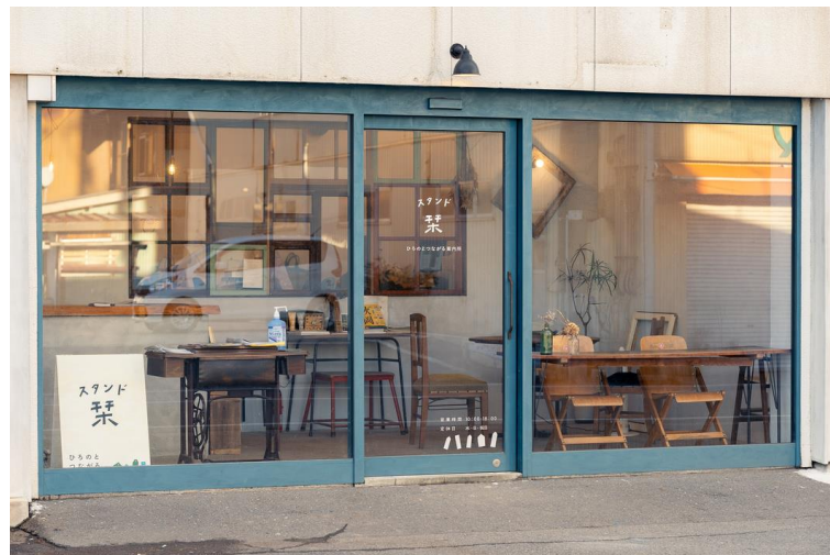
観光案内所 スタンド栞