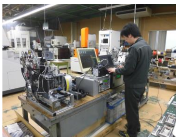
電気制御の確認作業