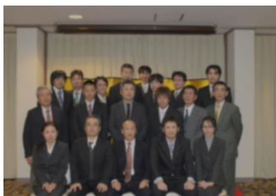
創設 20 周年記念

忘年会を始め、食事会をするなど社員交流もあり、活気のある仲の良い職場環境を作っています。