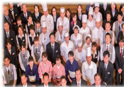
幅広い年代のスタッフ