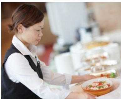
レストランスタッフ