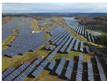
太陽光発電施設（メガソーラー）