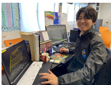
総合職だから多様なキャリアパス

全体の平均年齢は30歳ですが、北上営業所単独では驚愕の26歳といったお兄ちゃん集団です！まるで部活みたいな和気藹々とした雰囲気、何でも相談できるし、要らないことまで懇切丁寧に指導してくれ、休憩時間はスマホゲームでバトル！