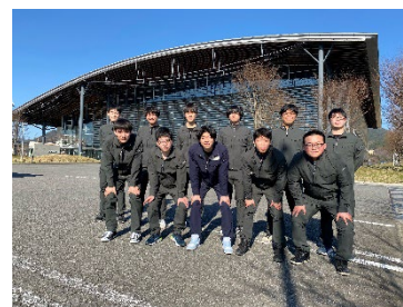
23卒新入社員11名@タクミアリーナ