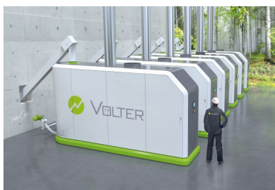
超小型木質バイオマス発電施設