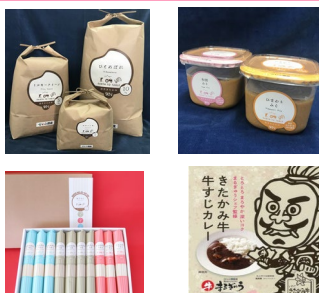
加工品 (精米・味噌・乾麺・レトルトカレー)

当社の仕事の柱である米穀作物（水稻・大豆・小麦・蕎麦）の収穫後は乾燥施設で乾燥後、調製（製品づくり）→検査→出荷、一部は精米・精粉など、自社で加工して販売、という流れでも行われます。