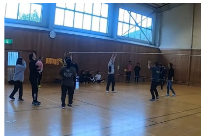
若手社員研修で一致団結！