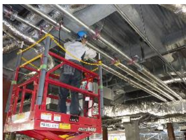
〔建設現場：配管作業〕