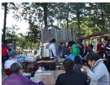
バーベキュー大会

社員旅行やバーベキュー大会、忘新年会の他に、階層別研修などの行事がたくさんあり、普段の仕事では会えない人達と接する機会が多く、コミュニケーションが取りやすい職場です。