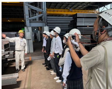
高校3年生の工場見学の様子！ 6人の工場見学者のうち 4名が入社予定！ (2024年4月入社予定)