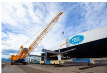
大型クレーンを動かして 鋼材（鉄）を動かす様子！