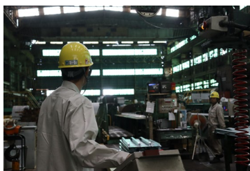
鋼材を加工している様子！