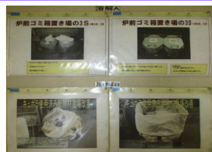
安全の基本、整理・整頓を地道に