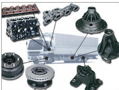
トラックの部品を製造