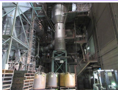
使用済の砂のリサイクルを推進

職場ごとに作業環境の改善に取り組み、安全に作業ができるよう、整理・整頓を実施しています。