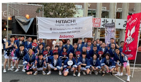
北上・みちのく芸能まつり

工場対抗野球部交流試合や大忘年会、北上・みちのく芸能まつりへの参加など、陽気で笑顔のある職場です。