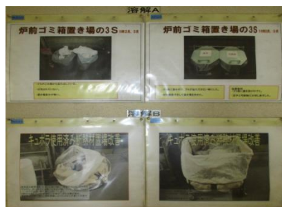
安全の基本、整理・整頓を地道に