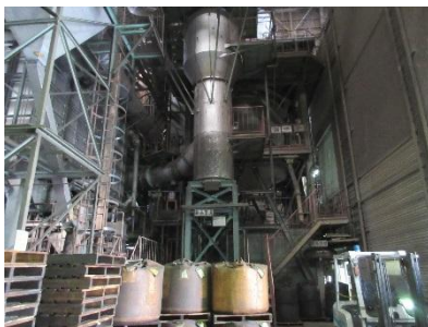
使用済の砂のリサイクルを推進

職場ごとに作業環境の改善に取り組み、安全に作業ができるよう、整理・整頓を実施しています。