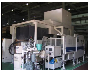
ダイカスト鋳造設備(800ton)

当社では、自動車用エンジン機器やブレーキ製品の部品を世に送り出すとともに、オイルポンプ・ウォーターポンプ等の加工組立品も生産しています。