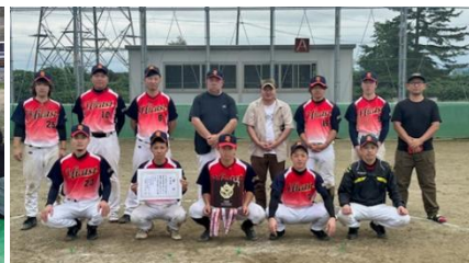
工業団地野球大会