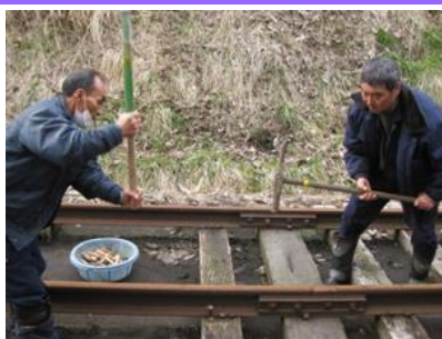
ベテランの手本（犬釘打ち）

歓迎会、忘年会、花見など定期的に開催し、コミュニケーションをはかっています。（苦手な方も居ると思うので、もちろん自由参加です！）