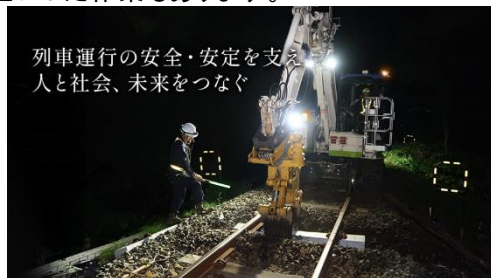
列車運行の安全・安定を支える 人と社会、未来をつなぐ