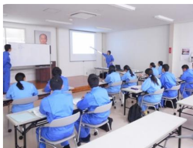
ゼロから学べる新入社員研修

そのために、ゼロから一つ一つ行う社員教育を行っています。「仲良く愉快地」働く文化がしっかり根付いた職場です。