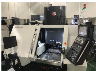
最新鋭の加工マシン