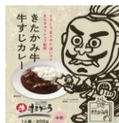
加工品 (精米・味噌・乾麺・レトルトカレー)

当社の仕事の柱である米穀作物（水稻・大豆・小麦・蕎麦）の収穫後は乾燥施設で乾燥後、調製（製品づくり）→検査→出荷、一部は精米・精粉など、自社で加工して販売、という流れでも行われます。黒毛和牛「きたかみ牛」は繁殖から肥育まで一貫生産、焼肉店「まるぎゅう」で自社生産のきたかみ牛を提供しています。