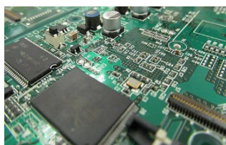
電子機械器具の組立