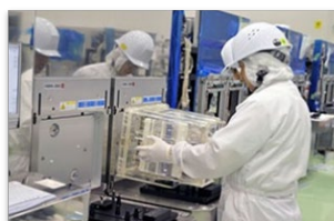
半導体製造装置の組立