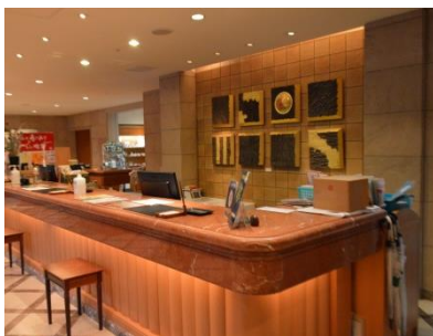
ホテルあえりあ遠野のフロント

また、遠野市を訪れる観光客やビジネス客、遠野市民の皆様にも愛される施設として、再び訪れていただけるよう願っています。