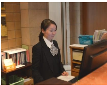
フロント、予約管理業務