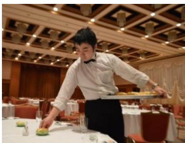
宴会等のサービス業務