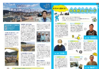
社内報 TK plus 現場紹介や失敗談の紹介など