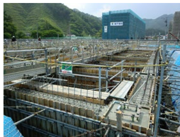
大槌消防庁舎建設(建築主体)工事 基礎型枠施工状況

主に建設現場で RC 建築物や土木構造物を作るために使われる コンクリートを成型する為に必要となる「型枠」を作っています 。コンクリートは工場から出荷した時は液体に近い状態になっているので、構造物として固まって形状を保つまでの間、型枠が必要となります。