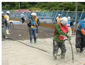
コンクリート打設状況

なお、 当社HPに掲載の社内報には現場で活躍する社員の苦労話などを紹介 しております。