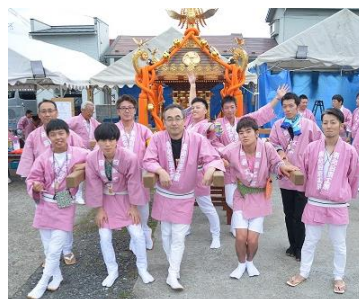
花巻まつりお神輿