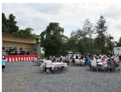
地域交流会の様子(2019年)