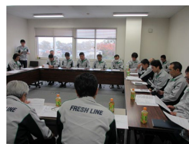
事故について検討します