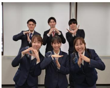
〔研修スナップ写真〕