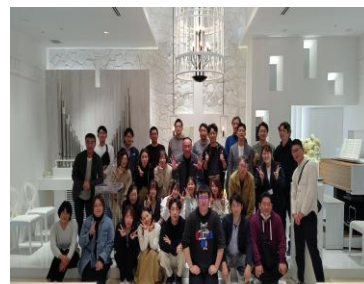
〔社員旅行（九州観光）〕