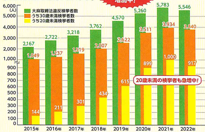
【大麻取締法違反検挙人員の推移】

その原因の一つとしてインターネット等に氾濫している「大麻は身体への悪影響がない」などの間違った知識や情報が影響していることが考えられており、注意が必要な状況です。