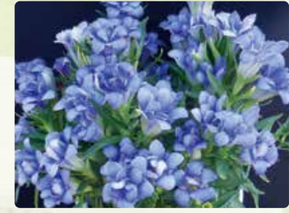
岩手県が開発した八重咲りんどう「いわて八重の輝きブルー」

やえざき 八重咲りんどう サフィニア サルビア サンパチェンス ペゴニア ペチュニア マリーゴールド