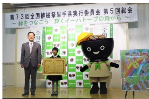
大会ポスター原画の表彰の様子