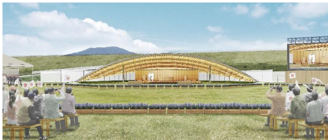
【お野立所デザイン】

お野立所の資材として、ナラ・アカマツ・スギ（県産木材）の3種類を選定するとともに、復興祈念公園の景観にふさわしい設計を行った。