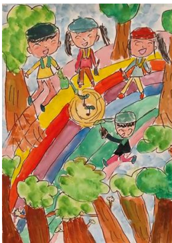
画題：『森に虹をかけよう！』