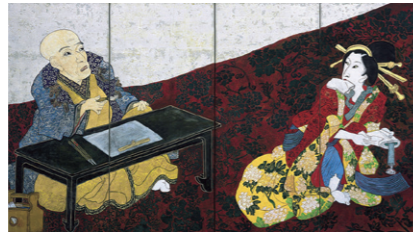
《面構 国貞改め三代豊国》 1976年 神奈川県立近代美術館蔵

日本画家、片岡球子による代表作「面構(つらがまえ)」シリーズからの作品に加え、その制作過程を示す貴重な下図も紹介します。