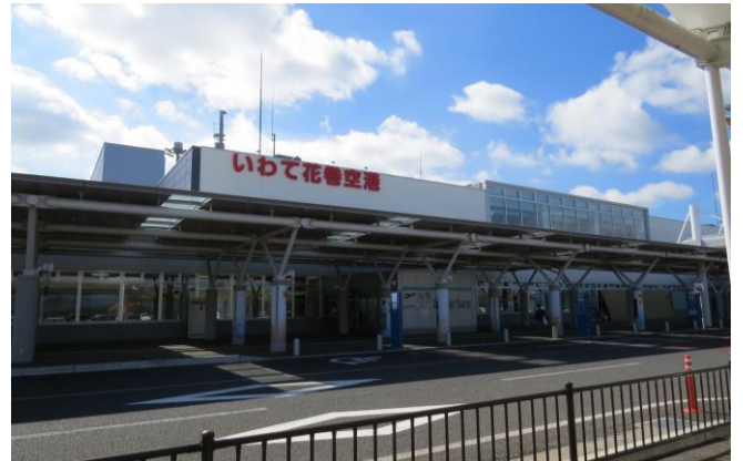
いわて花巻空港ターミナル

平成23年3月11日に東日本大震災が発災し、岩手県でも甚大な被害があり、特に被害の大きかった沿岸部では、その復旧・復興に向けて、全国から多くの支援を受けながら、防潮堤や水門などの大規模工事をはじめ、漁港などの復旧工事や災害復興住宅工事等が行われ、水産業など各産業で復興の取組が進められています。