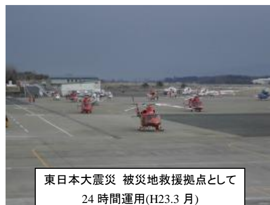
東日本大震災 被災地救援拠点として 24 時間運用(H23.3 月)