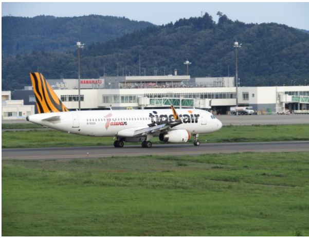
台北定期便 初便到着 (H30.8.1)