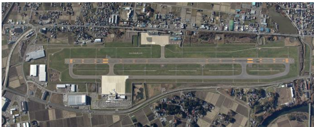
上空から見たいわて花巻空港

また、平成31年1月30日、国際定期便2路線目となる、「中国東方航空」による花巻～上海便も就航し、交流人口の拡大が期待されています。