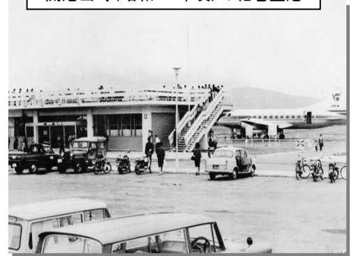
開港当時(昭和39年頃)の花巻空港