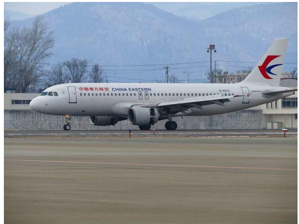
上海定期便 初便到着 (H31.1.30)