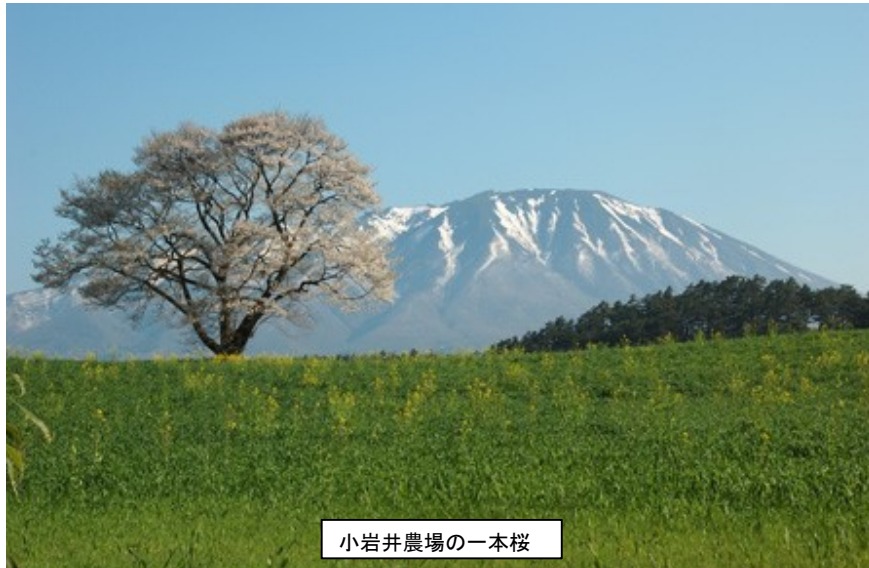
小岩井農場の一本桜