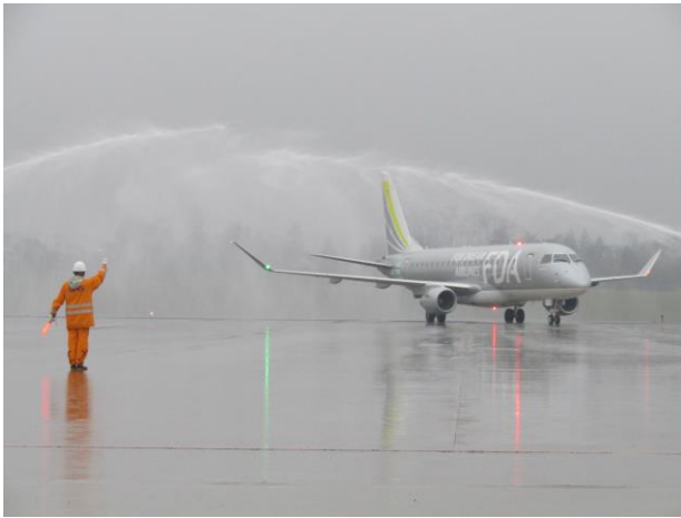
神戸定期便 初便到着 (R3.3.28)