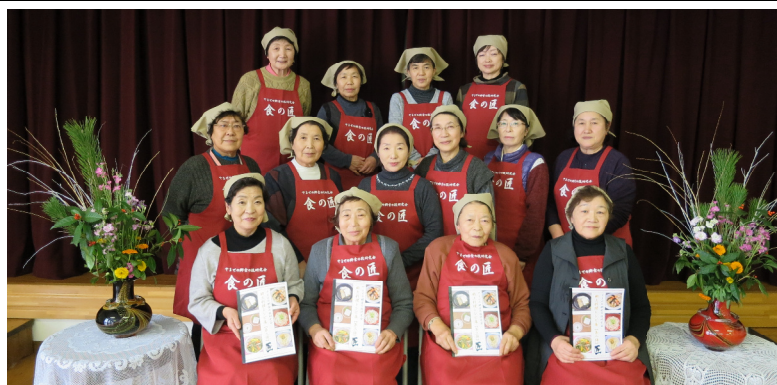
やませの郷食の技研究会