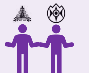
地域に支えられ、 地域を支える学校