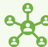
コミュニケーション を大切にする生徒