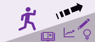
個性の伸長と 自己実現