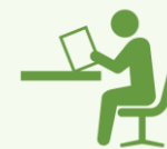
粘り強く取り組む 生徒