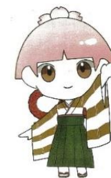
創立100周年記念 キャラクター とりよんちゃん