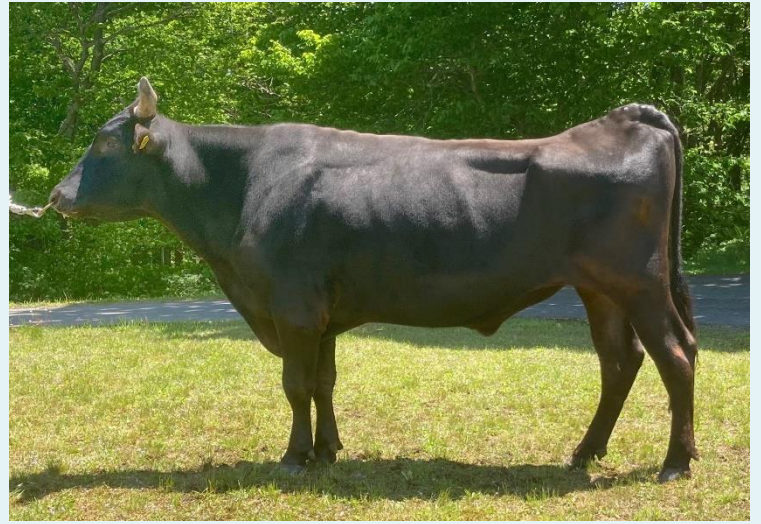
「美津貴」号 【美津照重×百合茂×安平×福桜(宮崎)×上福】