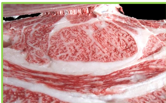
【③】 去勢：美津貴 × 飛良美継 × 菊安舞鶴