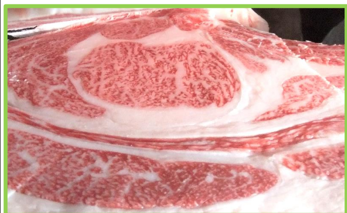
【④】 去勢：美津貴 × 白清85の3 × 平茂勝