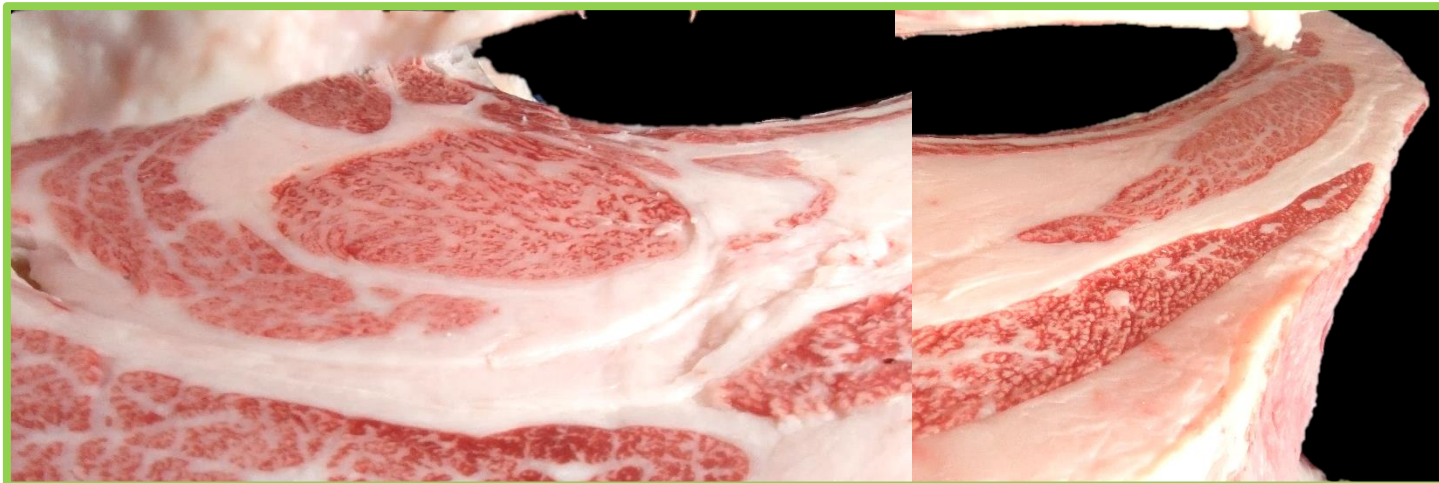
【①】 雌：美津貴 × 第2平茂勝 × 安平