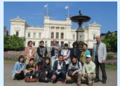
海外視察研修旅行