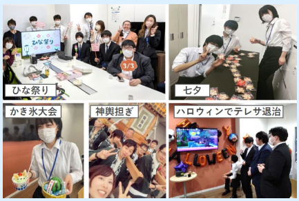
若手も参加したい季節のイベント

業務日報などの各種申請を紙からシステムへ変更したり、ChatGPTの導入によりビジネスメール作成の補助やイベント企画のアイデア出しなど、業務効率化につながっている。