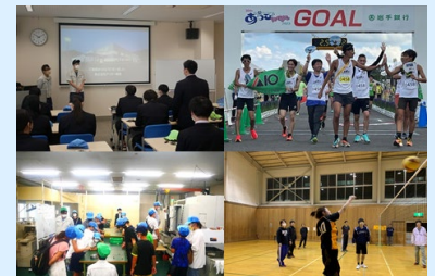
見学体験やスポーツなど