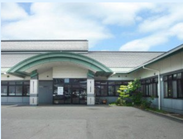
特別養護老人ホーム 明生園

高校生（福祉系以外）の在学中における初任者研修費用の全額補助の実施や、資格支援制度を創設などにより、若者の人材確保や人材の定着を実現している。