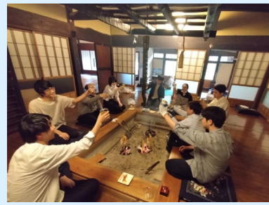
古民家でのワーケーション