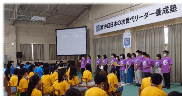
(リーダー塾「アジア・ハイスクール・サミット」発表の様子)

今年度は、県内9人の高校生が、7月26日(火)～8月8日(月)に福岡県宗像市ほかで開催された塾に参加しました。世界を舞台に活躍する著名人による講義やグループディスカッションを通じて、地域や世界で活躍しながら岩手に貢献する人間になりたいという意欲を高めることができました。