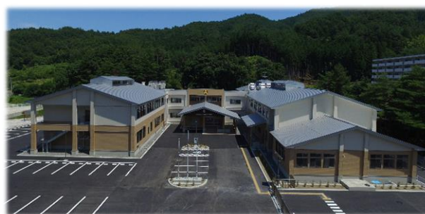
（県立釜石祥雲支援学校の新校舎）