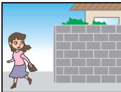
危ない場所から離れて！