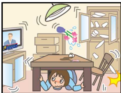
頭を守って、安全な場所に避難！

緊急地震速報を見聞きしたときの行動は、まわりの人に声をかけながら「周囲の状況に応じて、あわてずに、まず身の安全を確保する」ことが基本です。