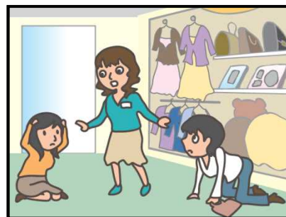
お店では、あわてず係員の指示に従って！