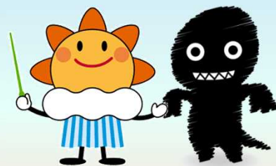
気象庁マスコットキャラクター「はれるん」 シェイクアウトキャラクター「シェイククエイク」