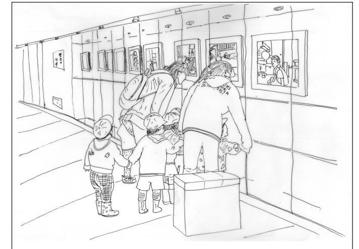
市民ギャラリー／展示ギャラリー<マルチユース> 地域住民や団体の展示会や教育機関と連携した催しのためのスペース