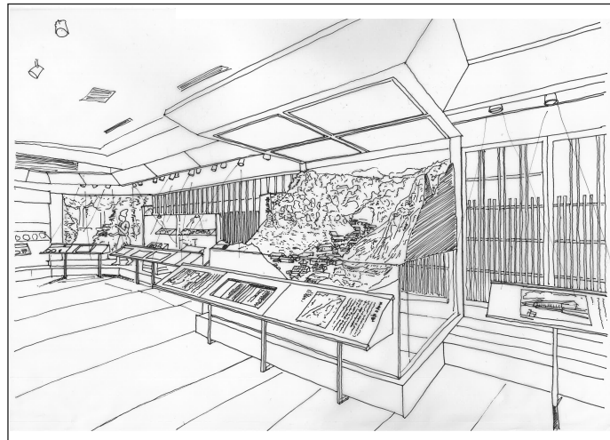
展示室A<世界遺産関連展示> ジオラマやマップを用いて世界遺産「平泉の文化遺産」全体を紹介