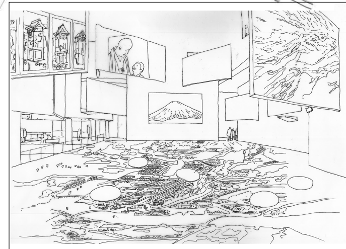
映像展示室<映像> 映像資料を用いて平泉の文化・歴史を幅広く紹介