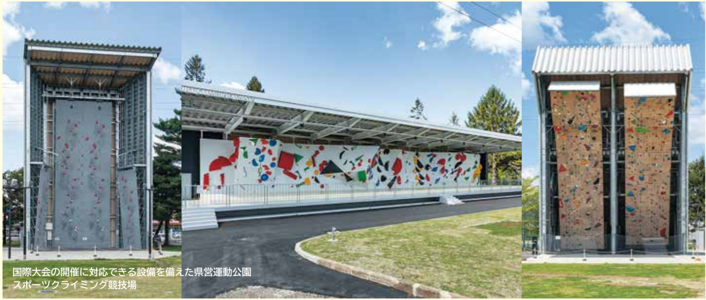
国際大会の開催に対応できる設備を備えた県営運動公園 スポーツクライミング競技場