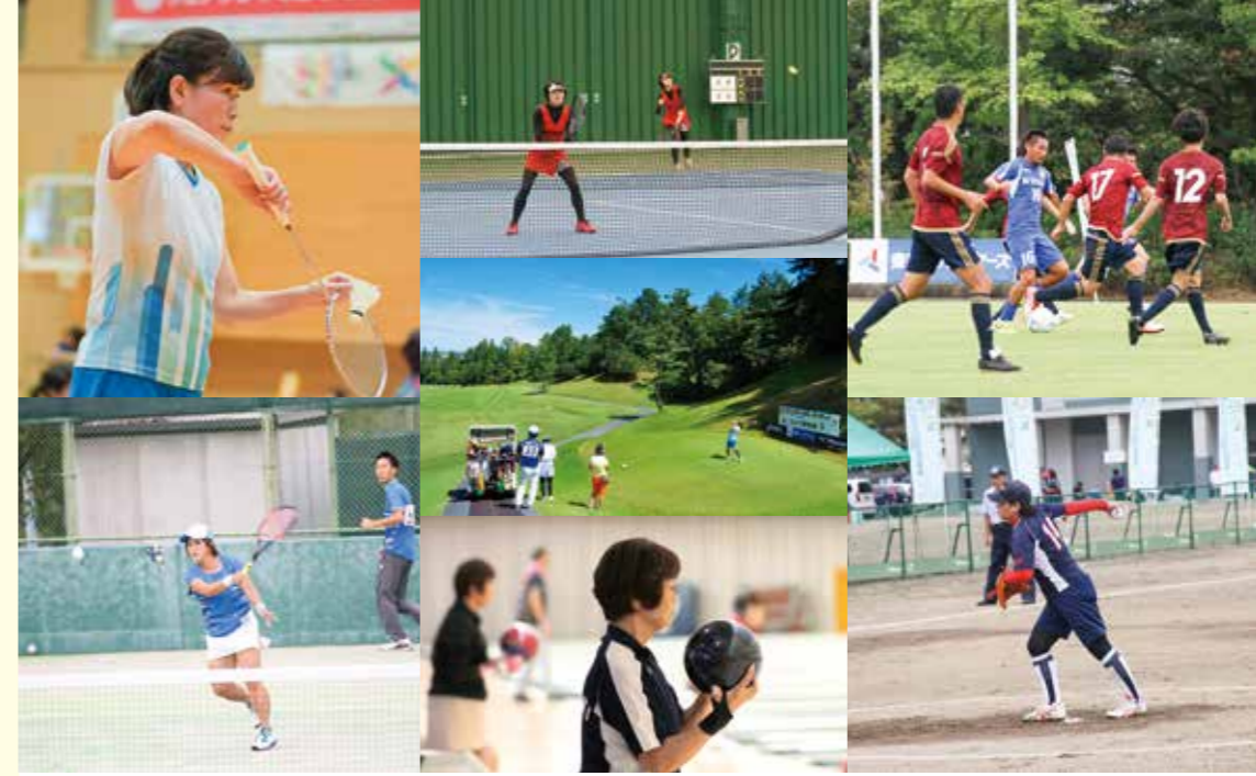
日本スポーツマスターズ過去大会の競技の様子