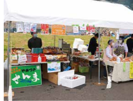
過去のスポーツイベント時のおもてなしの様子

軟式野球競技が開催される釜石市では、選手たちに地元産の木材で作るスマホスタンドなどが贈呈されます。会場では、仙人秘水や浜千鳥大吟醸フレイバーのジェラートなどが振る舞われるほか、ラーメンやカレー、お菓子など、自慢の特産品も販売し、大会を盛り上げます。