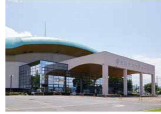
バスケットボール競技会場の盛岡タカヤアリーナ

5競技が開催される盛岡市では、7会場におもてなしのためのブースを設置。選手たちには特産品の南部せんべいを配布するほか、会場では、地元飲食店が出店して多彩な食事メニューを提供。選手や関係者、応援に訪れる皆さんを賑やかにおもてなします。