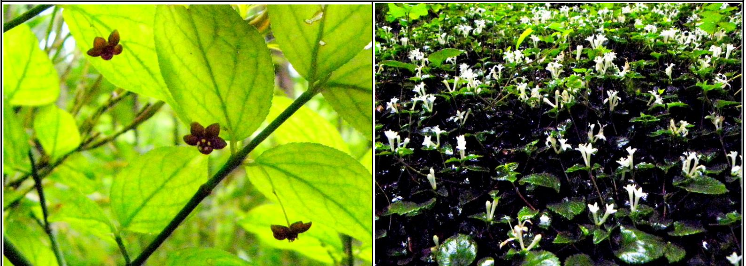
サワダツ(左)とツルアリドオシ(右)