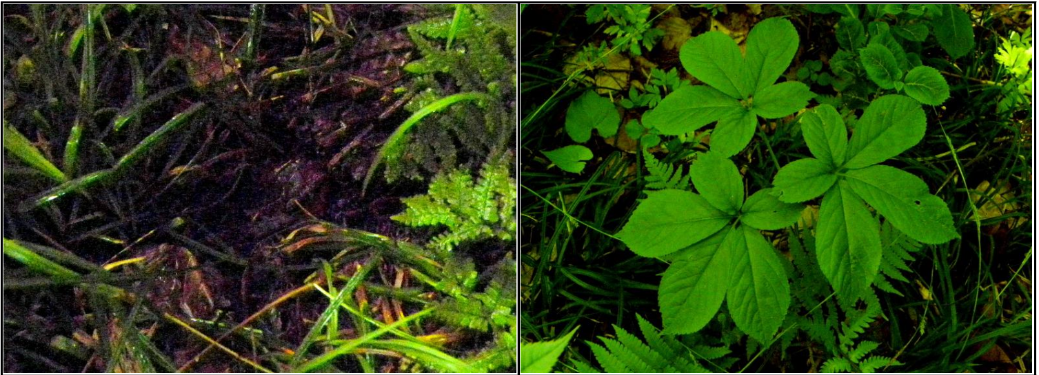
トチバニンジン盗掘跡(左)とトチバニンジン(右：2023.6.8撮影)