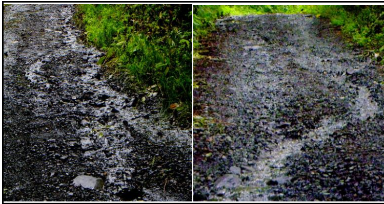
壊れた林道の様子

2023年7月17日の焼石情報です。天候は雨で、中沼登山口より入山しました。中沼駐車場までの林道は、降雨による流出で壊れていました（車での侵入は可能です）。登山口から30m程入った登山道脇に6月に生育していた「トチバニンジン」が盗掘されてなくなっていました。