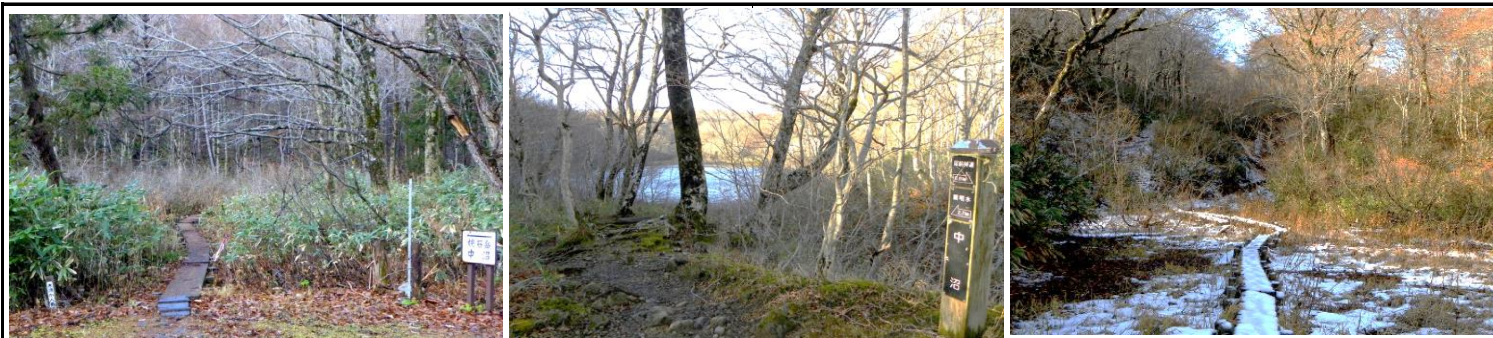
写真左から：中沼登山口、中沼ベンチ、中沼の木道

国道397号はトンネル手前で閉鎖になりましたので中沼林道を利用しました。中沼駐車場までは未だ積雪はありません。中沼登山口から入山しました。中沼より先には登山道に5～10cm程の積雪でした。