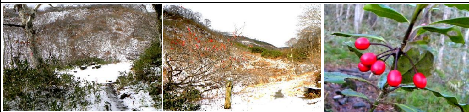
写真左から：銀明水、銀明水避難小屋前のナナカマド、ヒメモチの実

国道397号はトンネル手前で閉鎖になりましたので中沼林道を利用しました。中沼駐車場までは未だ積雪はありません。中沼登山口から入山しました。中沼より先には登山道に5～10cm程の積雪でした。