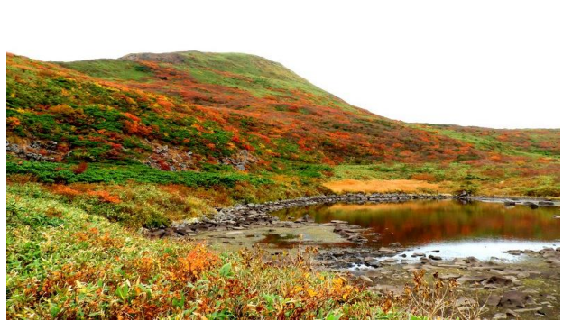
泉水沼から焼石岳