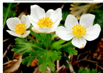
(上段左から) ツルシキミの実、ツルシキミの蕾、リュウキンカ