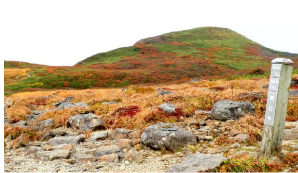
姥石より焼石岳を望む

中沼~上沼は紅葉のはしりが見られるようになってきています。銀明水から山頂にかけて、紅葉は今が見頃のようなのですが、残念ながら今年の焼石の紅葉は今のところあまり美しくありませんでした。