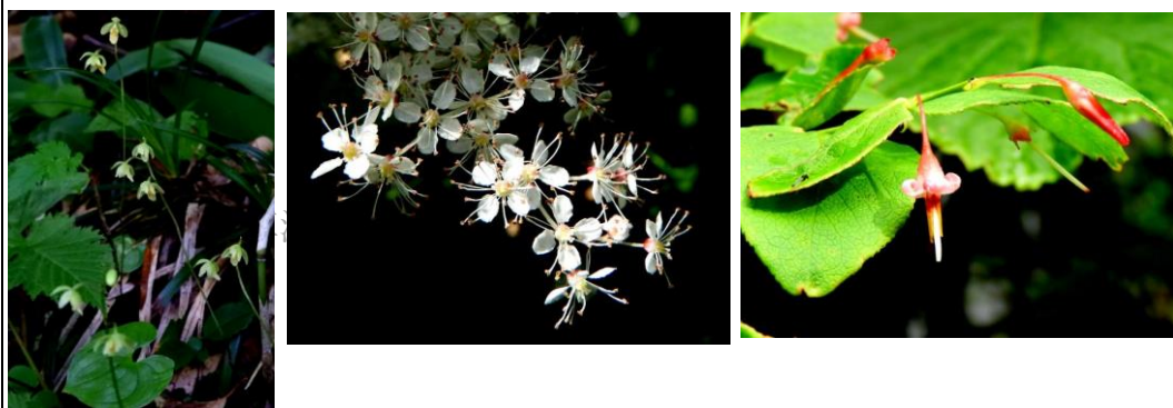
(写真左から) コイチヨウラン、オニシモツケ、アクシバ

中沼登山口より入山しました。7時前でしたが、既に20台ほどの車が駐車していました。他県からの登山者が多いようです。