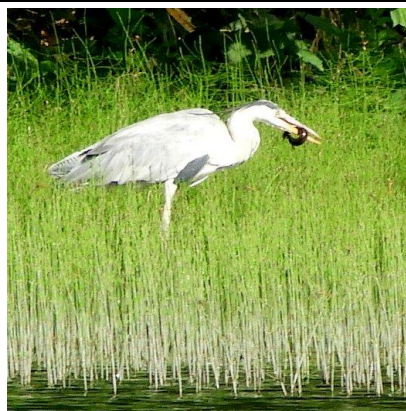
捕食するアオサギ(?)

リュウキンカも頑張っていました。ミツガシワ、イワイチョウ、エゾアジサイ、タチギボウシ、ヒオウギアヤメ、オニノヤガラが花は終わっていましたが数本見られました。