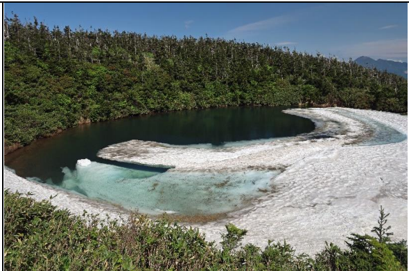
ドラゴンアイ（融解が進んでいます）

花情報： ミズバショウ、ショウジョウバカマ、ミツバオウレン、ベニバナイチゴ、ミヤカラマツ、コミヤマカタバミ、ミヤマスミレ、ハクサンチドリ、オオバキスミレ、エンレイソウ、シラネアオイ、キノガサソウ、ツバメオモト、ツマトリソウ、タケシマラン等が咲いていました。