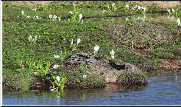
ミズバショウの群生