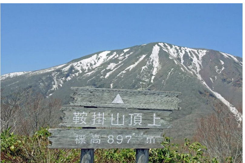
山頂（黄砂で霞んでた）

花情報 →、エンレイソウ、キクザキイチゲ、スマレ（2種類）、カタクリ、ウスバサイシン等