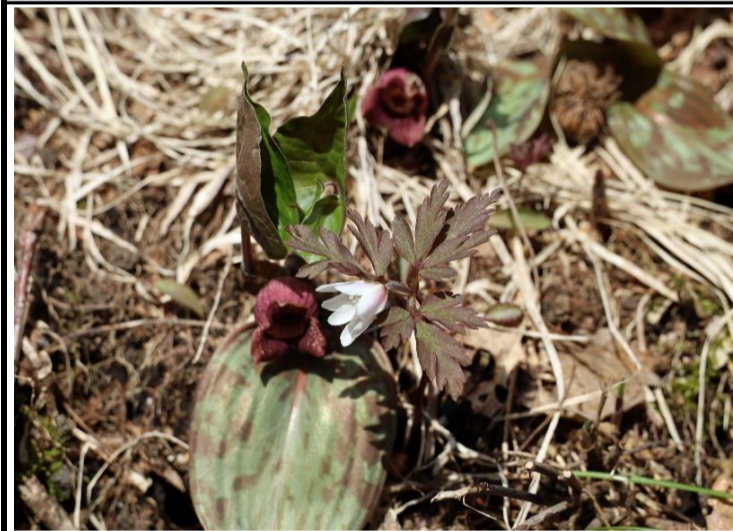
仲良く3種類が咲いていました

春の花を見に出かけた。駐車場の廻は桜が満開でした。登りは中央コースで下りは東側コースです。登りの途中にあるカタクリの広場はちょうど見ごろでした。下りの終点付近の松林では、春蘭が咲き始めていました。