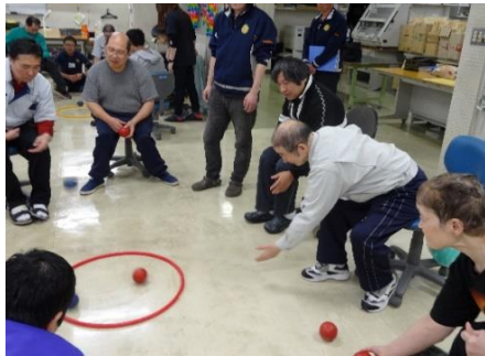
レクリエーションの一場面