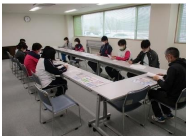
虐待防止をテーマとした内部研修