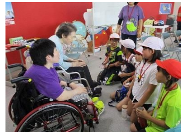
毎年行われる近隣の小学生との交流会