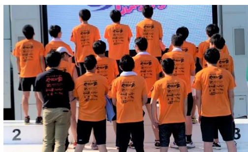
リレーマラソン参加