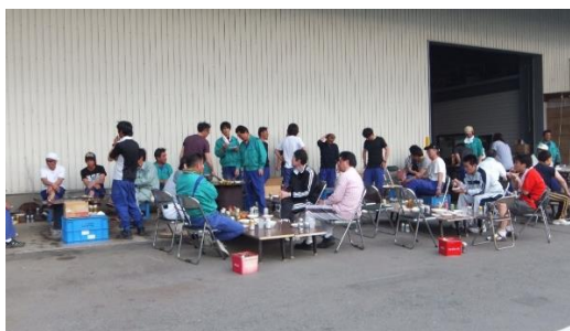
バーベキュー大会風景