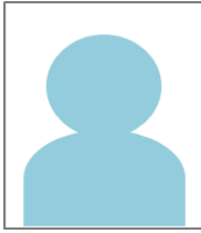
【盛岡工業高校 出身】 2020年入社

私は就職して、改めて質問する事の大切さを実感しました。働くにあたって分からないことは必ず出てきますがその時に聞くか聞かないかで作業後の結果が全く違うものになってきます。なのでどんな仕事をするにしても遠慮せずに質問することを心にとめておいて欲しいです。