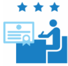
自己啓発支援あり