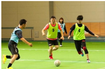
フットサル大会の様子