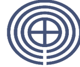
株式会社 三田商店

当社は「信用・信義」を社訓に120年余の長きにわたって地域の皆様とともに歩んで参りました。私たちは日々変革を続け、常に挑戦することがお客様に対する「責任」として地域社会の発展に努めております。