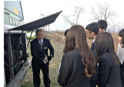
バスの車両について研修