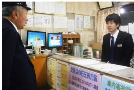
運行開始前の様子（点呼）