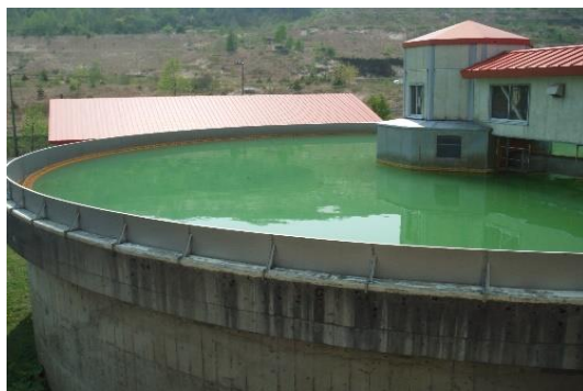
固液分離槽（処理された水）